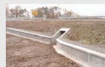
Amphibienschutz aus Beton