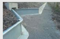
Amphibienschutz aus Stahl