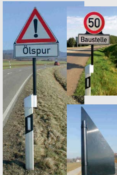
Klappschild aus Spezialkunststoff