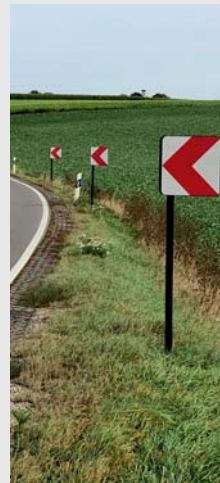
Richtungstafel aus Spezialkunststoff