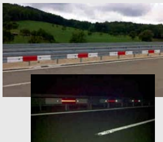
Kurvenleitprofil mit Reflektor