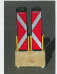
für 6 Stück