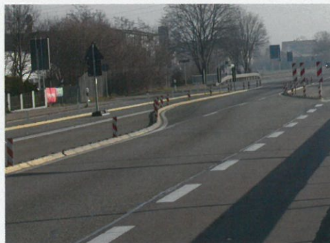
Zur Verkehrlenkung und Fahrbahntrennung To divert traffic and separate lanes