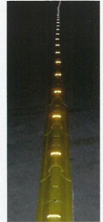
Nachtsichtbarkeit Night visibility