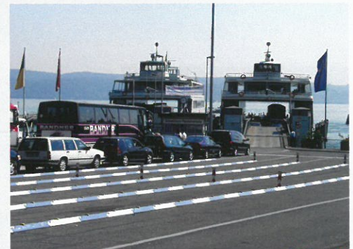
Wartespur-Trennung an einer Fähre Separation of queue-up lanes at a ferry

Die Leitschwelle ist sekundenschnell durch die Vater/Mutter-Verbindung montiert und wieder demontiert. Es kann ein Radius von mindestens 6 Grad verbaut werden. Dank speziellem Herstellverfahren keine Verformungsprobleme bei Wärme / Kälte. Durch Zugabe von Gummigranulat ist die Schwelle elastisch. Im Verbindungsbereich der Elemente werden beim Pressen zur Erhöhung der Festigkeit zusätzliche Versteifungen eingelegt. Ermittlung der optimalen, rutschfesten Form durch zahlreiche Anfahrtests.