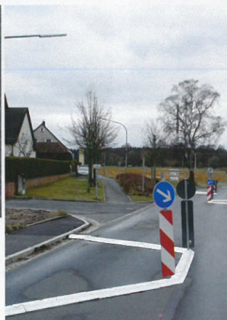
Winkelemente in einer Tempoberuhigungszone Corner elements in a residential zone

Winkelement - individuell auf Maß gefertigt Corner element - made individually according to request