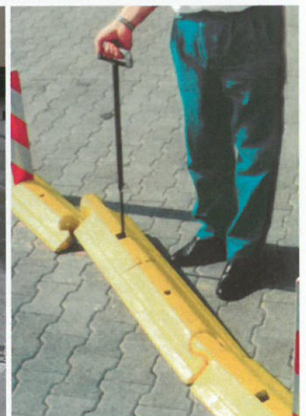
Problemloser Austausch mit Spezialhebewerkzeug Easy removal with special tool