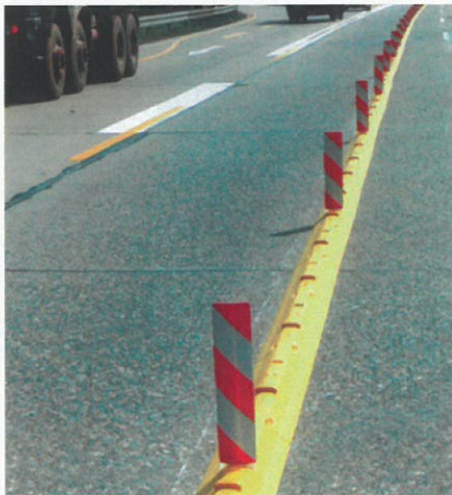
Fahrbahntrennung bei einer Autobahnbaustelle Lane marking in motorway roadworks