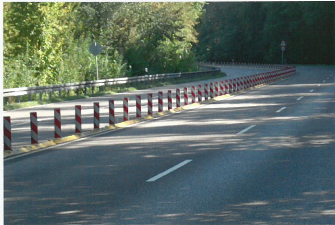
Fahrbahntrennung bei Überholverbot To prevent overtaking manoeuvres