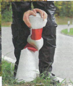
Balisette / Soft bollard