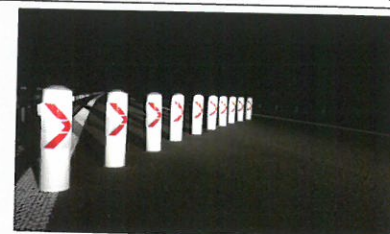
Weitere Varianten auf Anfrage / Other variants on request