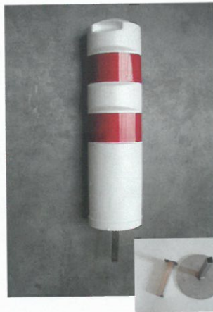
Balisette mit Bodenhülse zum Einbetonieren / Soft bollard with ground tube (installation on concrete)