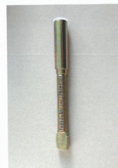
Befestigung mit Dübel Installation with dowel