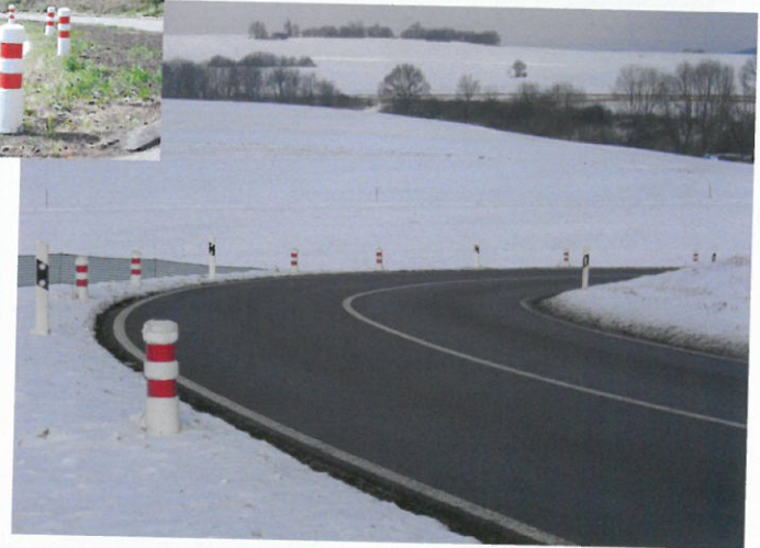
Kurven sichtbar machen (auch in der MVMot empfohlen) Indication of curves