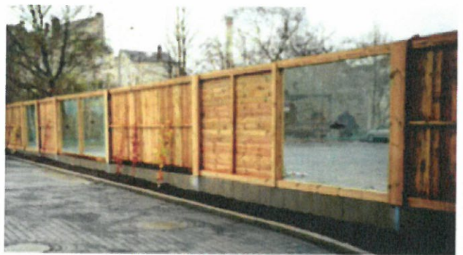
Lärmschutzwand aus Holz mit Acryl