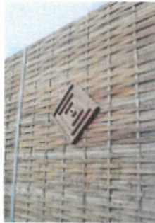
Lärmschutzwand mit Ornament