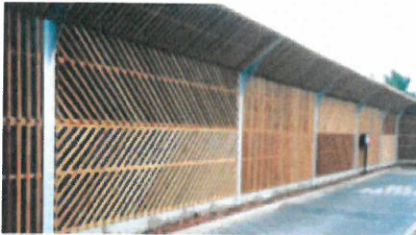
Lärmschutzwand an Parkplatzzufahrt

Die Elemente aus Holz können in unterschiedlichen Ausführungsvarianten geliefert werden. Von der preiswerten Flechtausführung bis zur Ausführung mit Halbrundlattung und rückseitiger Nut-Feder-Schalung. Die Elemente können reflektierend, ein- oder doppelseitig absorbierend geliefert werden.