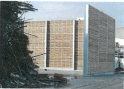
Lärmschutzwand an Recyclingbetrieb