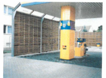
Lärmschutzwand an einer Tankstelle

Maibach Amphibienschutz- und Straßensicherheitsprodukte GmbH Alte Bundesstraße 155 A-5350 Strobl/Wolfgangsee