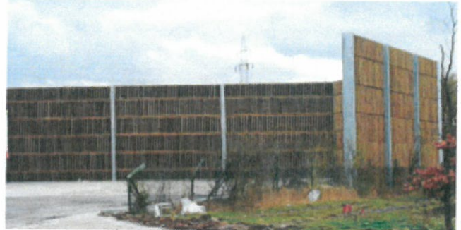
Lärmschutzwand bei einem Logistikbetrieb