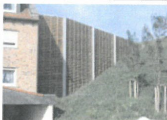
Lärmschutzwand an einer Wohnbebauung