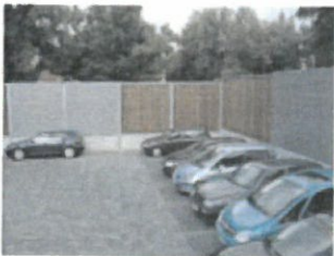
Lärmschutzwand an einem Parkplatz