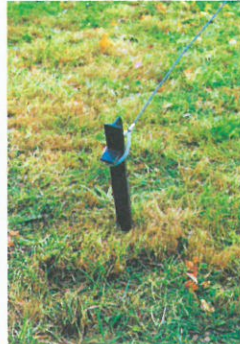
Hering und Seil peg and rope