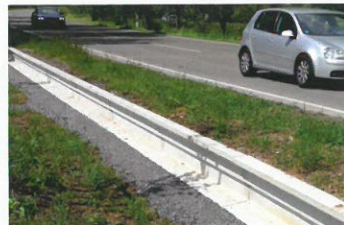
Beton / Concrete Sondervariante Laubfrosch-/Molchtauglich Special version proof for salamander and tree frog