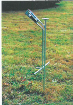
Haltepfosten, feuerverzinkt Support post, galvanized