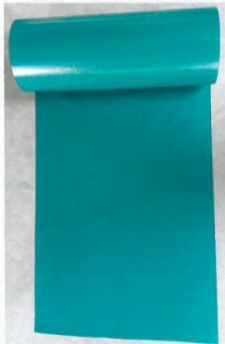
Gewebefolie Polyester foil