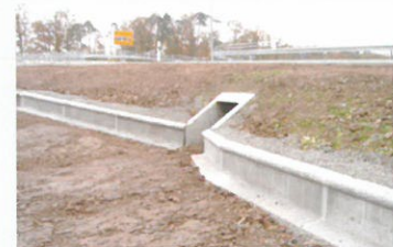
Beton / Concrete Standard