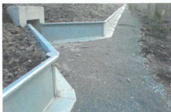
Stahl / Steel

We also supply permanent installations made of steel and concrete, with all accessories such as tunnels, stop drains and equipment for catching and counting of populations.