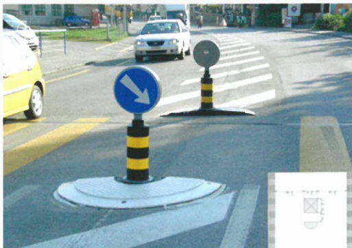
Fußgängerfurt mit Halbinseln Pedestrian ford with semicircles

Eine kreisrunde Insel setzt sich aus 2 weithin sichtbaren Halbselten zusammen, die problemlos zusammengefügt werden. Die Verwendung eines einzelnen Elements als Halbinsel ist ebenfalls möglich.