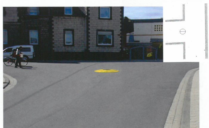
Beruhigungsinsel an einer Straßeneinmündung

Examples of configurations in slow speed zones