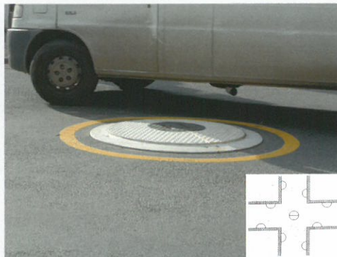
Mini-Kreisverkehr Small roundabout

A round island is composed of 2 semicircles, which can be easily put together. The semicircles can also be used individually as peninsulas