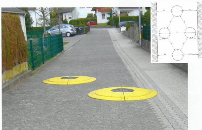
Gestaltungsbeispiele in verkehrsberuhigten Zonen

The soft speed reducer ensures constantly slow speed even on longer distances, instead of causing „stop and go“ traffic