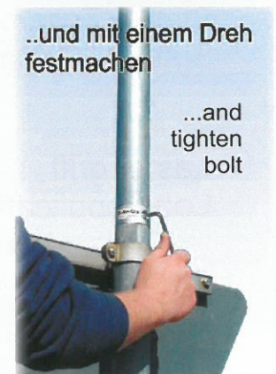
..und mit einem Dreh festmachen