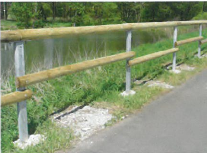
Ausführung mit einem Knieholm

Mit unserem Holz-Stahlgeländer können Wege und Straßenränder für Fußgänger und Radfahrer auf einfachste Art und Weise gesichert werden. Dieses System überzeugt nicht nur in seinem optischen Design, sondern bietet Ihnen vor allem eine wirtschaftliche Lösung. Zum einen durch den Einsatz von Materialien, die sich durch Langlebigkeit auszeichnen und zum anderen durch die einfachste Montage des gesamten Systems selbst.