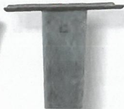
Stahlpfosten mit Aufnahmeplatte gerade

feuerverzinkt, Standard-Länge 2.000 mm Auf Wunsch auch andere Längen oder mit Fußplatte lieferbar.